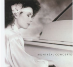
2 FELIX Nominations cat# JTR-8408-2

Montréal Concerto - 7 compositions de Marie-Andrée Ostiguy + 4 autres pièces.