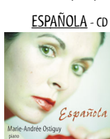
DC double cat# MAOCD-2002

ESPAÑOLA - CD double de musique espagnole classique de Granados et Albéniz.