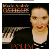
1 JUNO Nomination 1 FELIX Nomination cat# MAOCD-2001

TANDEM - 14 compositions de Marie-Andrée Ostiguy.